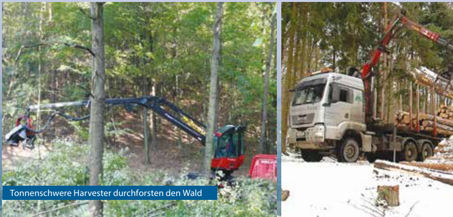
Tonnenschwere Harvester durchforsten den Wald

Wald ist ein wichtiger Naturraum und ein beliebter Erholungsbereich. Natur- und Artenschutz sind uns wichtig. Deshalb werden wir die Standorte für unsere Windkraftwerke sehr genau untersuchen lassen. Im Rahmen des Umweltverträglichkeitsprüfungsverfahrens werden unabhängige Fachleute des Landes NÖ den Standort genau prüfen und beurteilen. Eines ist klar: Nur wenn es keine Ausschließungsgründe gibt, werden wir diesen Windpark errichten!