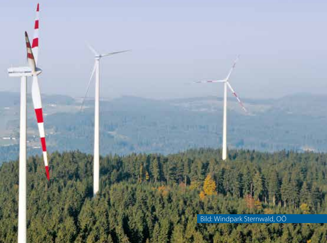
Bild: Windpark Sternwald, OÖ