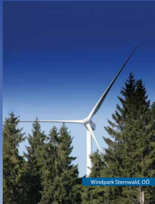
Windpark Sternwald, OÖ

Windkraft schafft Arbeitsplätze: in Österreich arbeiten derzeit mehr als 4.000 Menschen in der Windkraftbranche.